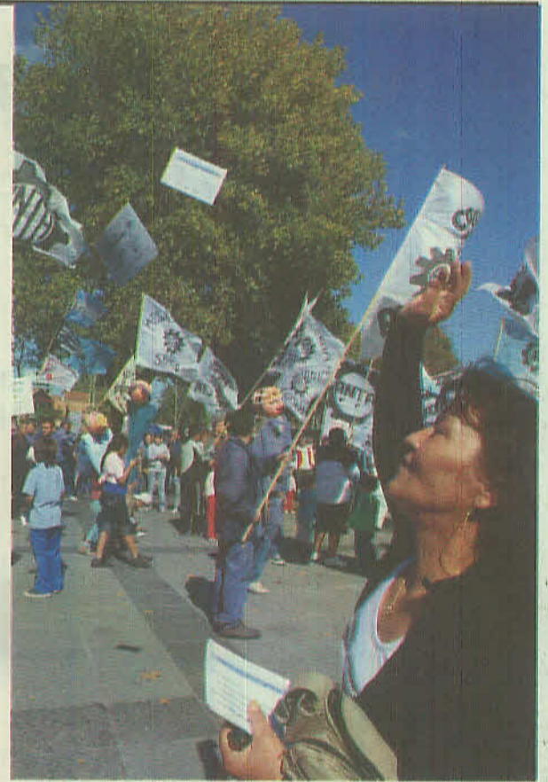
Todos, Todas dijimos Presente

para que pueda comenzar a atender en el Poli.