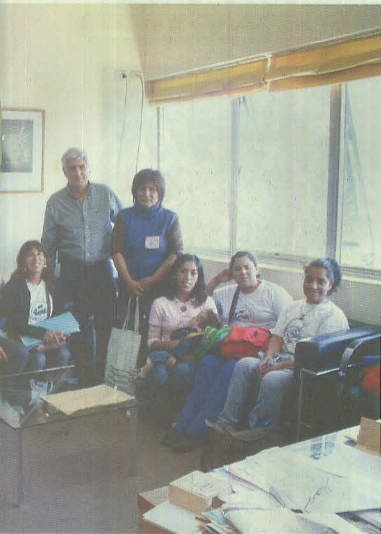
Organización organizada con Municipalidad de Avellaneda