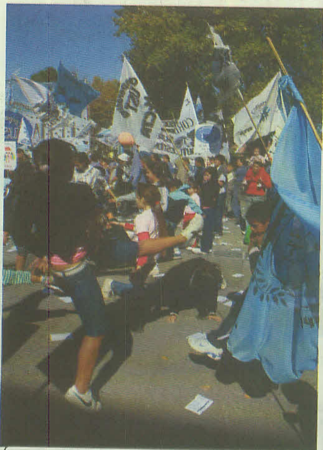
La murga también estuvo presente

Con una masiva participación, en el marco de la Campaña por la Salud, La Mesa de Organizaciones Barriales realizó La Caravana por un Centro Comunitario de Salud.