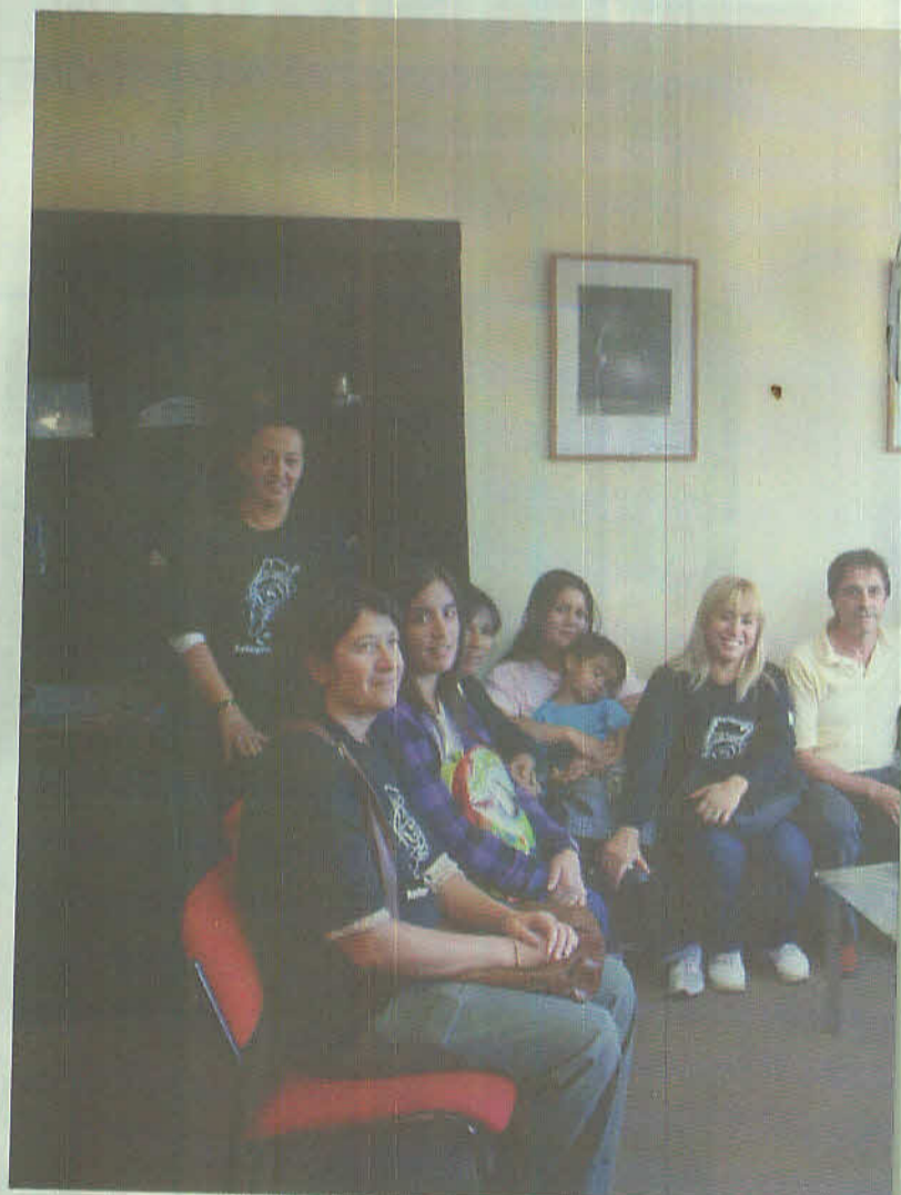
Reunión de la Comisión de Salud de la Mesa de O