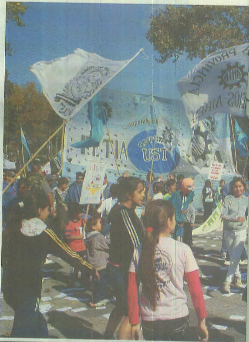
Llegada de la Caravana por la Salud