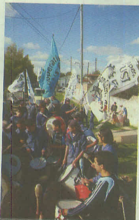
La partida de la Caravana por la Salud desde el Polideportivo de la UST