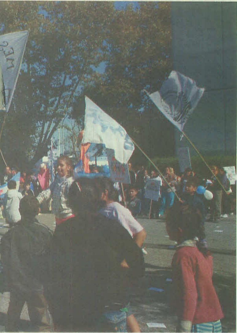
Organización organizada con Municipalidad de Avellaneda