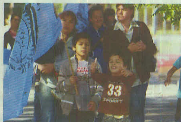
La Caravana por la Salud

Cooperativa "UST" / Banguito de la Buena Fe / Cooperativa "Coopafit" / "Con Fe y Esperanza" / Escuela N°38 / Jardín de Infantes N°921 / Parroquia "Nuestra Sra. del Valle" / Capilla "San Francisco de Asís" / Comedor de Madres "Santa Teresita" / Junta Vecinal "San Lorenzo" / Centro de Formación Profesional "UST" / Bachillerato "Arbolito" de UST / Cooperativa "El Hornero de Wilde" / Comisión de Madres "Las Casitas" / Comedor "Piechos Embarrados" / Murga "Despejando la Calle" / Polideportivo "Capitán Giachino" / Centro Juvenil "Evita"