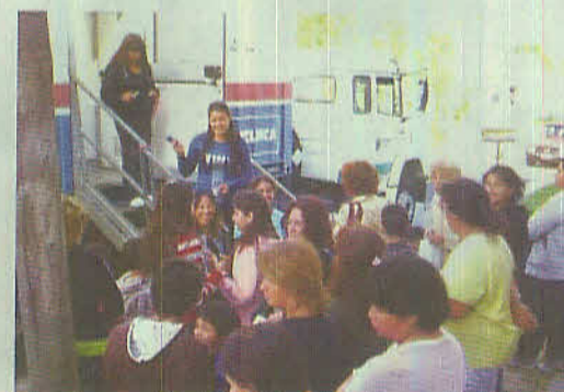
El Trailer de Salud en el Poli