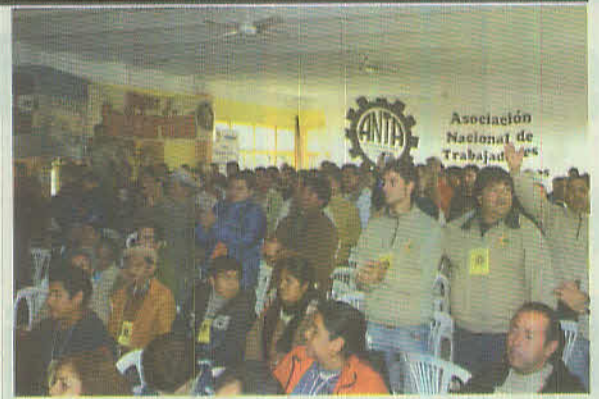
Primer Congreso de ANTA