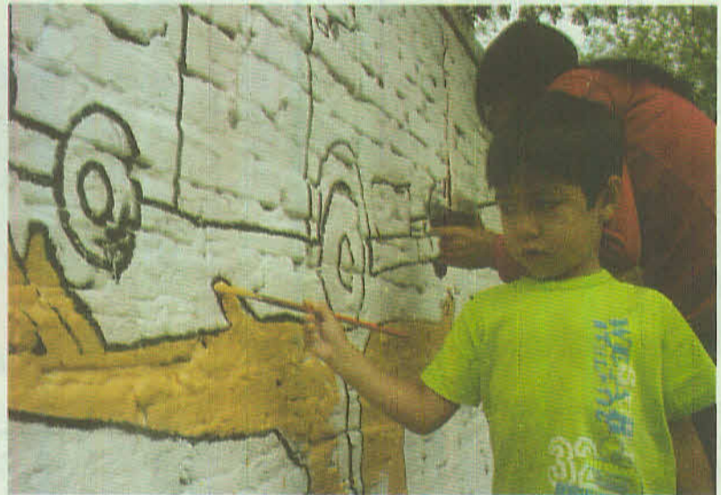
Convencidos que "en una comunidad organizada todo es posible"

Historia que se hace todos los días, con cada acción, con cada pincelada. En frente de Don Vicente (Güamini y Godoy Cruz), en Pino y Las Flores, en el paredón de COMSAT, en Lobos y en cada dibujo que hicieron los chicos en el campamento. Pintamos todos, cada uno poniendo su color, sus ideas, confluyendo en lo que todos soñamos salud, educación, vivienda y trabajo digno para todos. Haciendo foco, en la Salud como derecho.